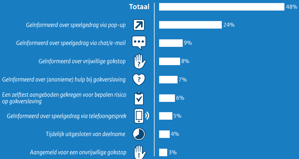
Figuur 3. Hoeveel procent van de online gokkers zijn door aanbieders bereikt?

Noot. Betreft Nederlanders van 16 jaar en ouder met deelname in de afgelopen 12 maanden.